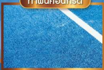
ทาพื้นคอนกรีต