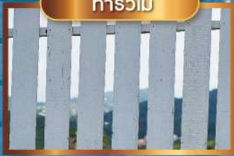
ทารั้วไม้