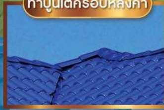
ทาปูนใต้ครอบหลังคา