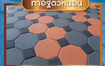
ทาคิวตัวหนอน