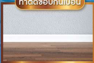
ทาดัดขอบกันเปื้อน