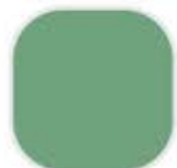
3-25-5 Mistral Breeze