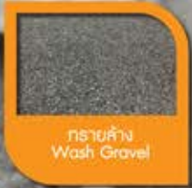
กรวยล้าง Wash Gravel