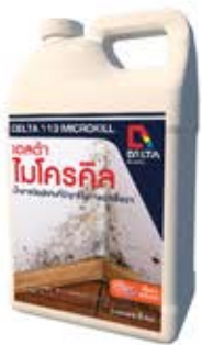
เดลต้า ไมโครคิลล์ น้ำยาฆ่าเชื้อรา และตะไคร่น้ำ