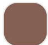
5-4-5 Muddy Paws