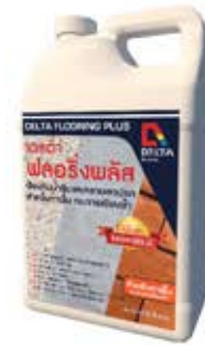
เดลต้า ฟลอริงพลัส น้ำยาเคลือบเงาใสกั้นซึม สำหรับพื้น