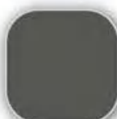
Dark Grey 9002