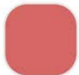
2-2-6 Garden Fragrance