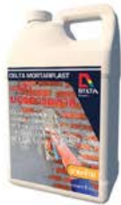
เดลต้า มอร์ตาร์พลาส น้ำยาผสมปูนฉาบ