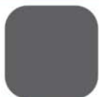
Dark Grey / เทาเข้ม