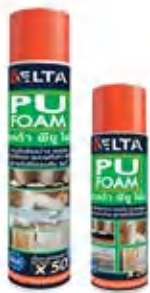
เดลต้า พียูโฟม สปรีย์ สำหรับรูโหว่ อุดช่องว่าง รอยต่อ