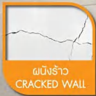
ผนังร้าว CRACKED WALL