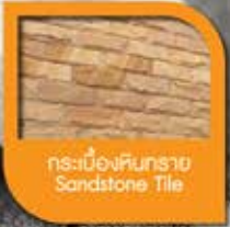
กระเบื้องหินทราย Sandstone Tile