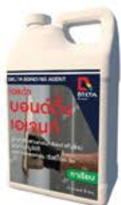
เดลต้า บอนด์ดิง เอเจนท์ น้ำยาผสมปูนทราย สำหรับ ช้อน และ ประสานคอนกรีต