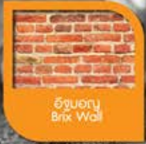
อิฐโชว์แนว Brick Wall