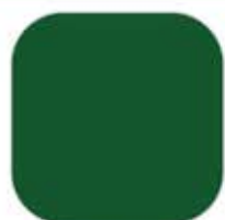
Green / เขียว