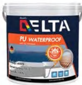
เดลต้า พียู วอเตอร์พรูฟ สำหรับดาดฟ้า หลังคา