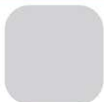
Grey / เทา