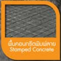
พื้นคอนกรีตพิมพ์ลาย Stamped Concrete