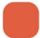
1-3-6 Orange Harvest