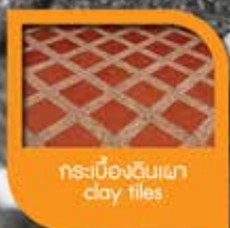
กระเบื้องดินเผา clay tiles