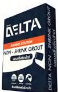
เดลต้า นอน ชริงก์ กร้าท์ จีพี ปูนกร้าท์ไม่หดตัว กำลังอัดสูง