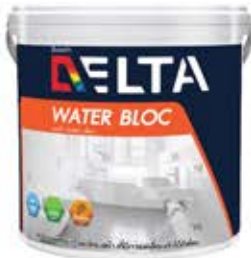
เดลต้า วอเตอร์ บล็อก ชนิดยืดหยุ่นสูง ใช้งานได้ทันที