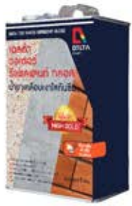
เดลต้า วอเตอร์ รีเพลแลนท์ กลอส น้ำยาเคลือบเงาใสกั้นซึม สำหรับผนัง