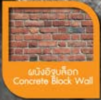
ผนังอิฐบล็อก Concrete Block Wall