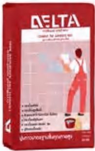
ปูนกาว เดลต้า แดง ปูกระเบื้องขนาดใหญ่ และสระว่ายน้ำ