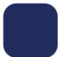
Blue / น้ำเงิน