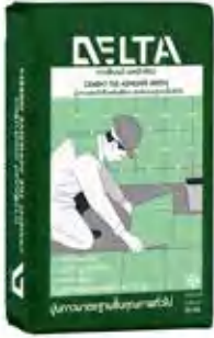
ปูนกาวซีเมนต์ เดลต้า เขียว ปูกระเบื้องชนิดมาตรฐาน