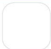
White / ขาว