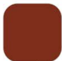
Brown / น้ำตาล