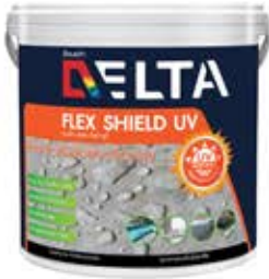
เดลต้า เฟรค ชิลด์ ยูวี ชนิดยืดหยุ่น ส่วนผสมเดียว