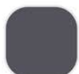
5-29-6 Shadow Wood