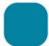
1-32-7 North Shore