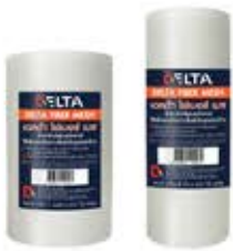
เดลต้า ไฟเบอร์ เมช ผ้าตาข่ายไฟเบอร์กลาส