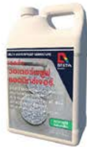
เดลต้า วอเตอร์พรัฟ แอดมิคซิเจอร์ น้ำยากันซึมผสมคอนกรีต