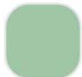
3-25-4 Alpine Haze