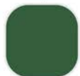
3-25-7 Echuca Green