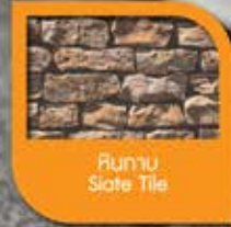
หินล้าง Slate Tile