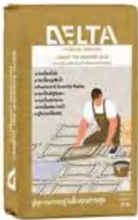
ปูนกาวซีเมนต์ เดลต้า ทอง ปูกระเบื้องขนาดใหญ่พิเศษ