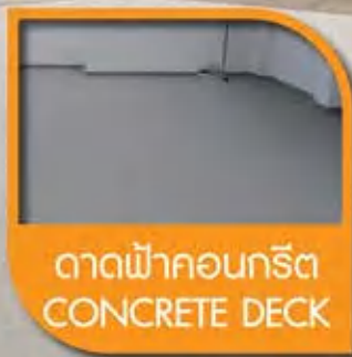
ดาดฟ้าคอนกรีต CONCRETE DECK