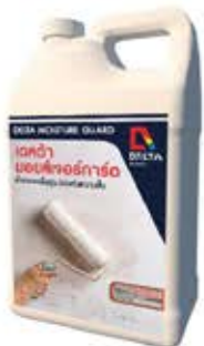
เดลต้า มอยส์เจอร์ การ์ด น้ำยาป้องกันความชื้น

อัตราการใช้งาน : 30 ตร.ม. / 1 กล. (5 ลิตร) ขนาดบรรจุ : 5, 25 ลิตร สี : -