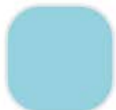
1-32-3 Sky Delight