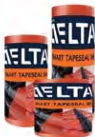
เดลต้า สมาร์ท เทปซีล บิวทิลเกรด สำหรับซ่อมแซม กันสาด รางน้ำฝน