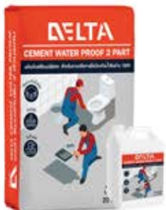
เดลต้า ซีเมนต์ วอเตอร์พรูฟ ชนิดยืดหยุ่น 2 ส่วนผสม