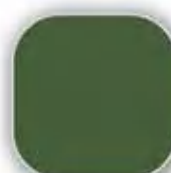
Dark Green 8002